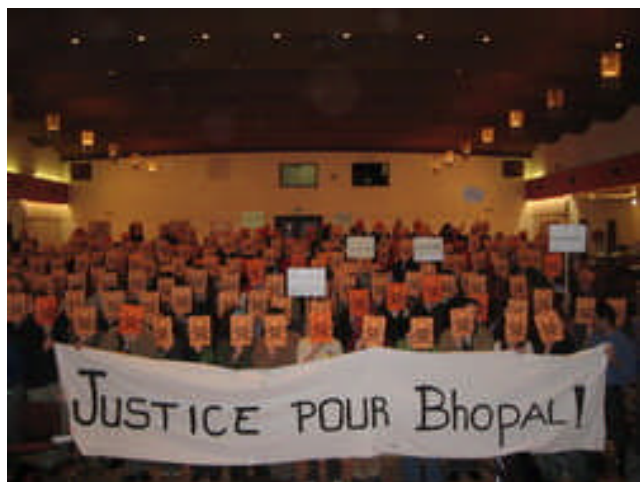
Jeunes d'Amnistie et d'Oxfam prennent part à une action en Belgique en 2005 demandant que justice soit rendue à la population de Bhopal.

Selon le droit international, les États ont la responsabilité ultime de respecter, protéger et promouvoir les droits humains. Cependant, les entreprises ont un impact immense sur les droits des individus et des communautés. Cet impact peut être positif par la création d'emplois. Pourtant, les entreprises peuvent contribuer à la violation des droits humains par manque de prévoyance ou d'une planification appropriée, ou par des gestes délibérés. Ensemble, les entreprises et les États ont donc un rôle à jouer pour s'assurer que les droits humains ne sont pas minés par les opérations d'une entreprise.