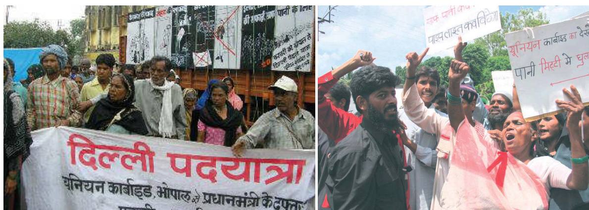
Des survivants de Bhopal et des sympathisants marchent à New Delhi, en Inde, mai 2006

Inlassablement, ils ont fait campagne afin que soit correctement nettoyé le site, qu'une indemnisation satisfaisante leur soit accordée et que les responsables soient tenus de répondre de leurs actes. Les victimes et leurs sympathisants, dont des enfants et des handicapés, sont allés jusqu'à parcourir plusieurs fois les 800 kilomètres séparant Bhopal de New Delhi. Des militants ont par ailleurs organisé des rassemblements, des pétitions et des grèves de la faim.