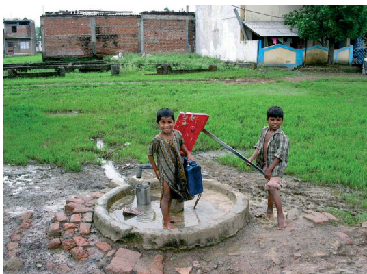
Deux garçons puisent de l'eau à une source contaminée à Sunder Nagar, une colonie de Bhopal en 2004. Les pompes contaminées sont peintes en rouge par le gouvernement.