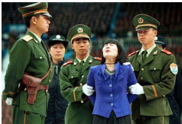
Une femme crie à l'écoute du verdict avant qu'on l'amène pour être exécutée dans une ville du sud de la Chine, à Ghangzhou.

Liu Renwen, professeur de droit pénal chinois, a estimé, au début de 2006, que la Chine