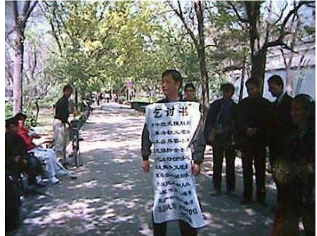
Le défenseur pour les droits humains, Chen Guangcheng, a été condamné à quatre ans et trois mois de prison. Il a été inculpé d'avoir « endommagé la propriété publique et d'avoir organisé un rassemblement pour bloquer le trafic » en juin 2006 à la suite de sa détention incommunicado pendant trois mois.

réunion annuelle de l'Assemblée populaire nationale (l'assemblée législative chinoise), qui s'est tenue du 5 au 16 mars 2007 à Beijing.