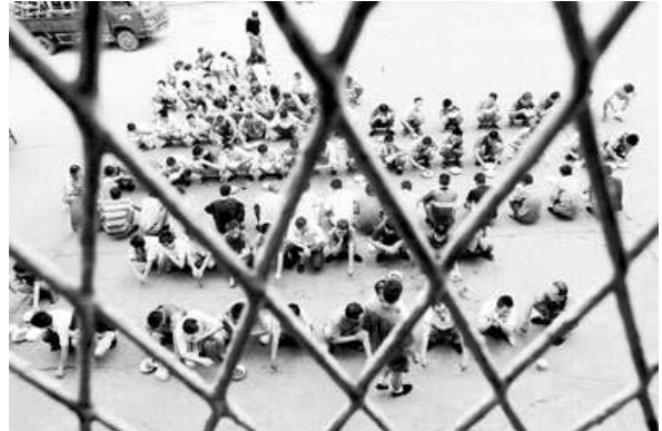
Détenus pendant le lunch dans un centre de rééducation par le travail.

Sur l'ensemble du territoire chinois, plusieurs centaines de milliers de personnes seraient détenues dans des centres de « rééducation par le travail » , souvent dans des conditions très difficiles. Parmi elles figurent des petits délinquants, des détracteurs du gouvernement et des adeptes de « croyances interdites ».